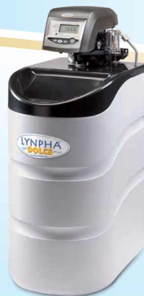
LYNPHA DOLCE PLUS

Attraverso un microprocessore ed un contatore di litri incorporati nella valvola centralizzata, LYNPHA DOLCE effettua la rigenerazione delle resine in base alla quantità d'acqua realmente utilizzata (volume). Dal momento che il consumo d'acqua per ogni abitazione di solito è variabile il computer adegua la frequenza dei cicli di lavaggio in funzione del volume d'acqua prodotta giornalmente. Il timer elettronico calcola il consumo medio dei giorni precedenti e lo rapporta con la capacità ciclica residua del sistema. In caso di mancanza di alimentazione elettrica tutti i dati calcolati vengono mantenuti in memoria da uno speciale "Chip". Su richiesta, gli addolcitori LYNPHA DOLCE possono essere forniti completi di dispositivo automatico di produzione cloro in grado di sterilizzare il letto di resine ad ogni ciclo di rigenerazione.